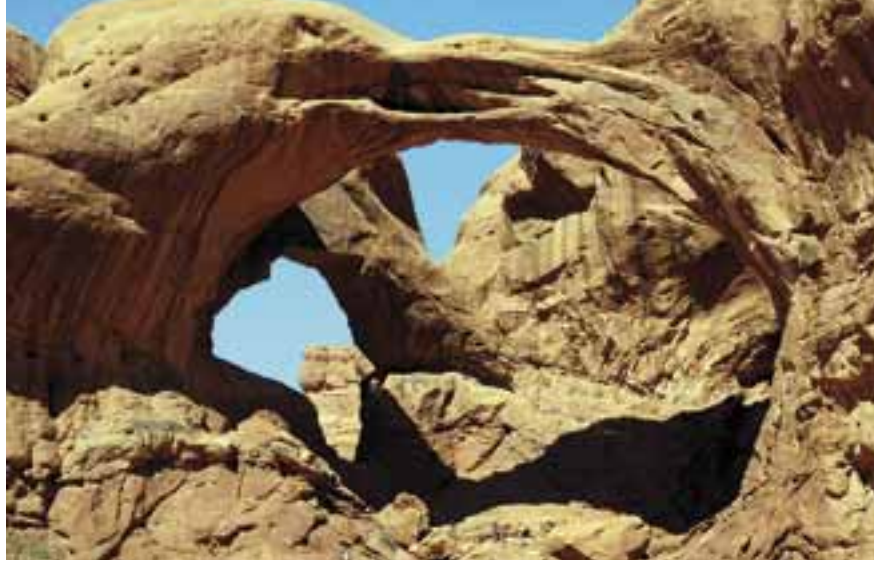
DOUBLE ARCH, ARCHES NATIONAL PARK

Het is ruim 250 kilometer rijden naar Capitol Reef. Veel valt onderweg niet te beleven. Tussen de steden Green River en Hanksville zoeken we een picknickplaats in het state park Goblin Valley, vijftien kilome-